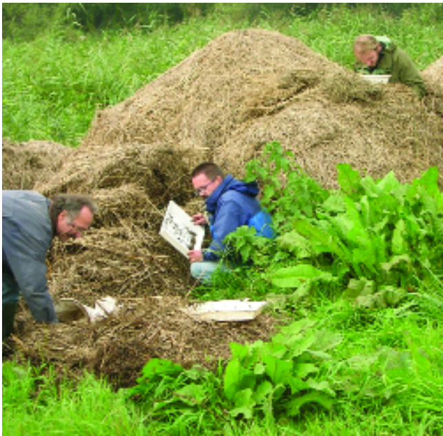
Figuur 2. De vindplaats van de compostmier Hypoponera punctatissima . The location of the here described record of H. punctatissima.

De keverfauna van de hooihopen werd uitgebreid bemonsterd door middel van handvangsten en met behulp van een keverzeef. Tezamen met een eerdere bemonstering in maart 2004 werden 140 soorten kevers aangetroffen. Hieronder bevond zich een aanzienlijk aantal karakteristieke soorten voor hopen oud hooi en composthopen, onder andere de loopkever Perigona nigriceps (Dejean), de kortschilden Astenus pulchellus (Heer), beide Lithocharis -soorten, Gauropterus fulgidus (Fabricius), Philonthus debilis (Gravenhorst) en Trichiusa immigrata Lohse, vijf Monotoma -soorten, Ahasverus advena (Waltl) en de zeldzame zwartlijf Myrmecichixenus vaporariorum Guérin. Afgaande op dit kevergezelschap is hier sprake van een zeer goed ontwikkelde fauna van oud hooi en compost.